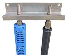
Supporto murale Inox per 2 lance Cod. 20904 (Solo con modello a parete)