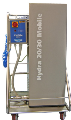
Versione mobile Cod. 1067/R Cod. 1067/CR