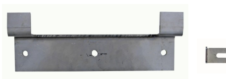
Staffa in acciaio Inox per fissaggio Cod. 33804+ Cod. 33012 (Solo con modello a parete)