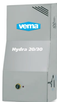
Versione a parete Cod. 1065