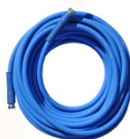
Tubo A.P. da 20mt. BLUFOOD con raccordi da ½” femmine Cod. 18262/FFX/20000