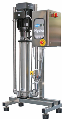
Versione in Skid

Il sistema di lavaggio a media pressione che vi assicura bassa silenziosità, bassa usura, bassi costi di gestione, e bassa produzione di aerosol.