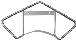
Supporto murale Inox per tubo Cod. 20903