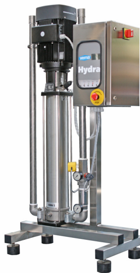
Versione in Skid