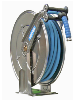
Arrotolatore Automatico Cod. 10520/BS (Sez. 50)