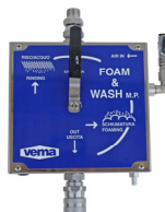
Vasta gamma di Stazioni di dosaggio schiuma - Fissi e carrellati (Sez. 16)