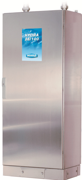
Versione in Armadio