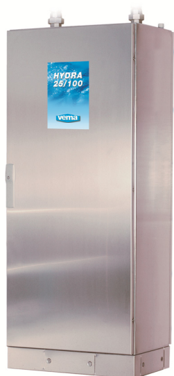
Versione in Armadio