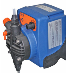
Pompa dosatrice per detergente a controllo elettronico con tenuta in Nitrile 5 l/min - 7 Bar Cod. 43111