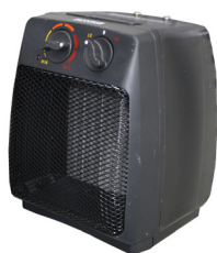
Termoventilatore Antigelo con termostato Cod. 99030