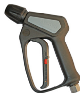
Pistola ad estrazione Ø 14 Cod. 25095/ST