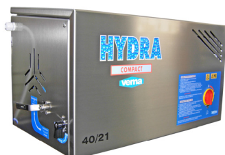
Versione a Parete