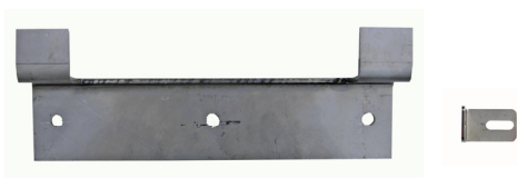
Staffa in acciaio Inox per fissaggio Cod. 33804+ Cod. 33012 (Solo con modello a parete)