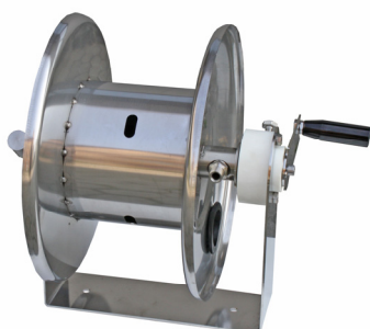
Arrotolatore manuale Inox Cod. 10400/X (Solo Versione Mobile)