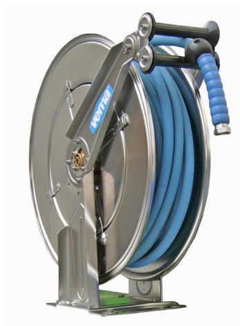
Arrotolatore automatico Inox (Senza Tubo) Cod. 10500 (Sez. 50)