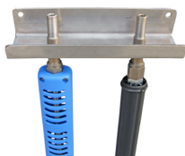
Supporto murale Inox per 2 lance Cod. 20904 (Solo con modello a parete)