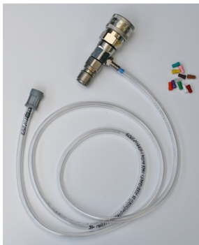
Iniettore Inox per processo di disinfezione Cod. 21318/S