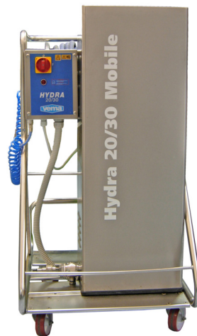
Versione mobile Cod. 1067/R Cod. 1067/CR