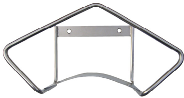
Supporto murale Inox per tubo Cod. 20903