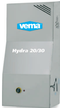
Versione a parete Cod. 1065