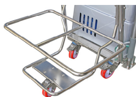
Porta Fusto Doppio Inox con ruota Cod. 33112/2R