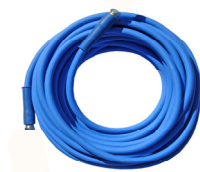
Tubo A.P. R/2 da 20 mt. Antimacchia con pressature 3/8" femmine zincate Cod. 18220