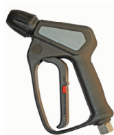
Pistola ad estrazione Ø 14 Cod. 25095/ST