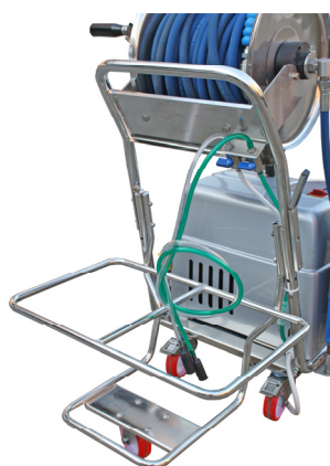
Kit Doppia Aspirazione Porta Fusto Doppio con N. 02 Mini Valvole a sfera per dosaggio detergenti Cod. K80